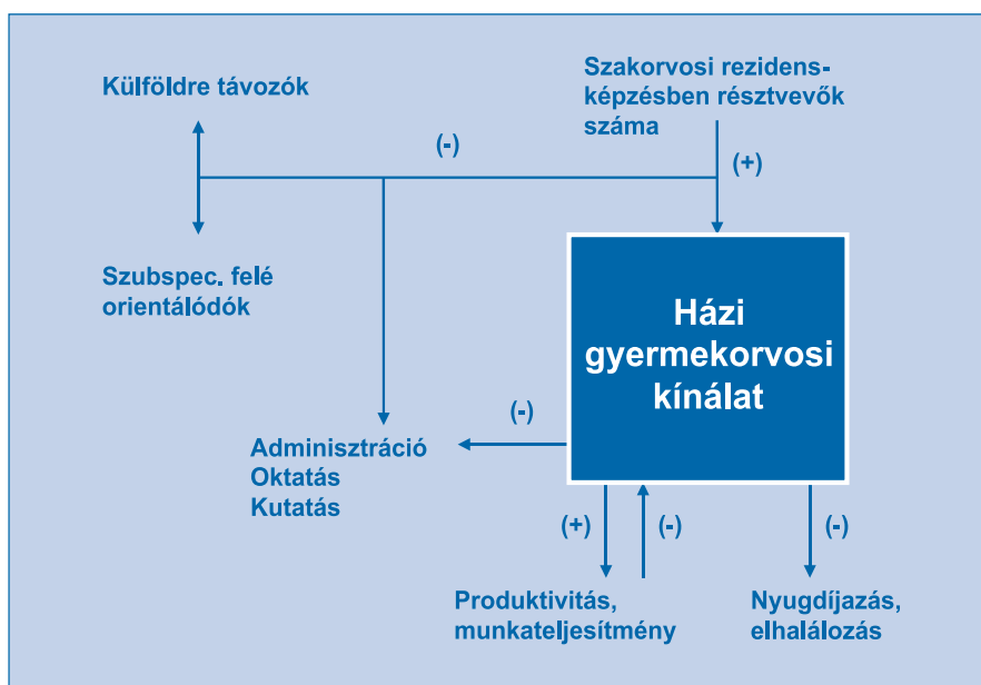
1. ábra A házi gyermekorvosi kínálatra ható tényezők

Sok helyen – elsősorban a fővárosban és a nagyvárosokban – ahol mindössze 2–3 órás rendelésekre van lehetőség, az elmélyült, minőségi gyermekorvosi munkára kevés idő jut. Pedig az átalakult gyermekorvosi tevékenység több időt követel. A testi tünetekben megnyilvánuló pszichoszociális zavarok felismerése, a kiterjedtebb eszközhasználaton alapuló definitív betegellátás, vagy a szűrések teljes körű elvégzése hosszabb rendelési időket indokolna. És természetesen ennek megfelelő finanszírozást, hogy ne kelljen óvodába, iskolába szaladgálni a megalázó, de mégis szükséges jövedelemkiegészítésért. Az arányosan megnövelt forrásokkal