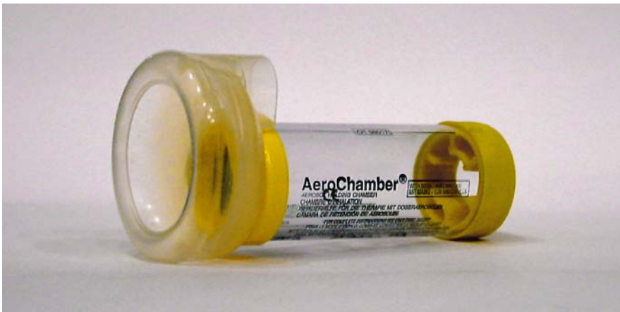
2. ábra Kis volumenű műanyag toldalék maszkkal – Aerochamber

tartó kezelést. Állapotrosszabbodásaik el-látását a következő bekezdés tartalmazza.