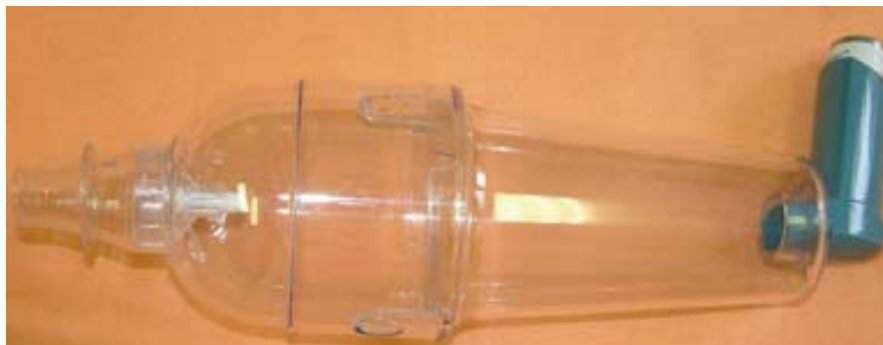
1. ábra Nagy volumenű műanyag toldalék – Nebuhaler

Enyhe, intermittáló tüneteket mutató asthmás gyermekek nem igényelnek fenn-