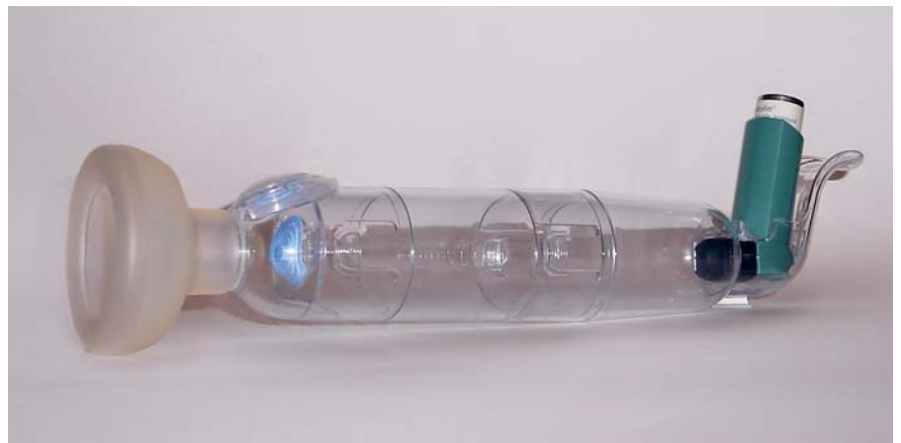
3. ábra Kis volumenű műanyag toldalék maszkkal – Babyhaler

Az inhalációs szteroidkezelést az esetek jelentős részében nem önmagában adjuk. Gyakran kombináljuk egyéb