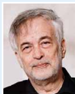
Shimon Barak, Tel-Aviv Az Alapellátó Gyermekorvosok Európai Szervezetének (ECPCP) elnöke

Az Alapellátó Gyermekorvosok Európai Szervezetének (ECPCP) elnöki posztját szeptembertől Shimon Barak, Tel-Avivban élő alapellátó gyermekorvos tölti be. Munkájához ezúton is sok sikert, jó egészséget kívánunk. Részben kinevezése kapcsán, részben pedig az alapellátás hazai átszervezésének terve körüli hírek, hírfoszlányok miatt érezzük aktuálisnak a leendő elnök egyik legutóbbi, a gyermek-alapellátás 21. századi kihívásaival foglalkozó közleménye rövidített változatának közlését. A téma fontosságát és aktualitását bizonyítja néhány megkérdezett alapellátó gyermekorvos kolléga véleménye, amelyekből kommentárként idézünk egy-egy kiragadott gondolatot.